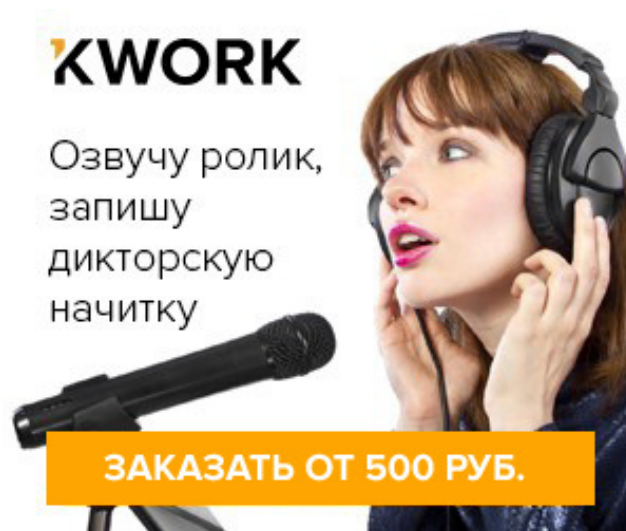
Примеры виджетов для сайтов

Сначала приведите собственных клиентов на Kwork, чтобы заработать рейтинг. Затем, по мере роста рейтинга, вы будете получать всё больше и больше новых клиентов на Kwork. Со временем маленький ручеек клиентов превратится в бурный поток.